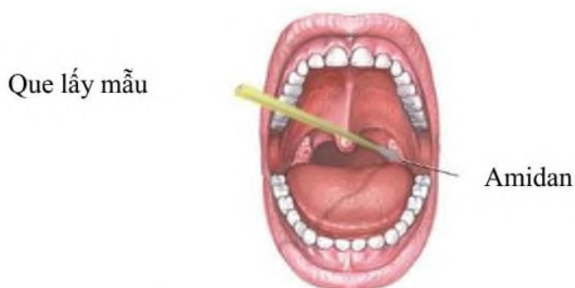
Miết vào 2 bên amidan và thành bên họng

- Đóng nắp, xiết chặt nắp ống bệnh phẩm và bọc ngoài bằng giấy parafin (nếu có).