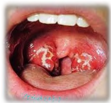
Dùng que lấy mẫu tại vùng có đốm trắng, giả mạc