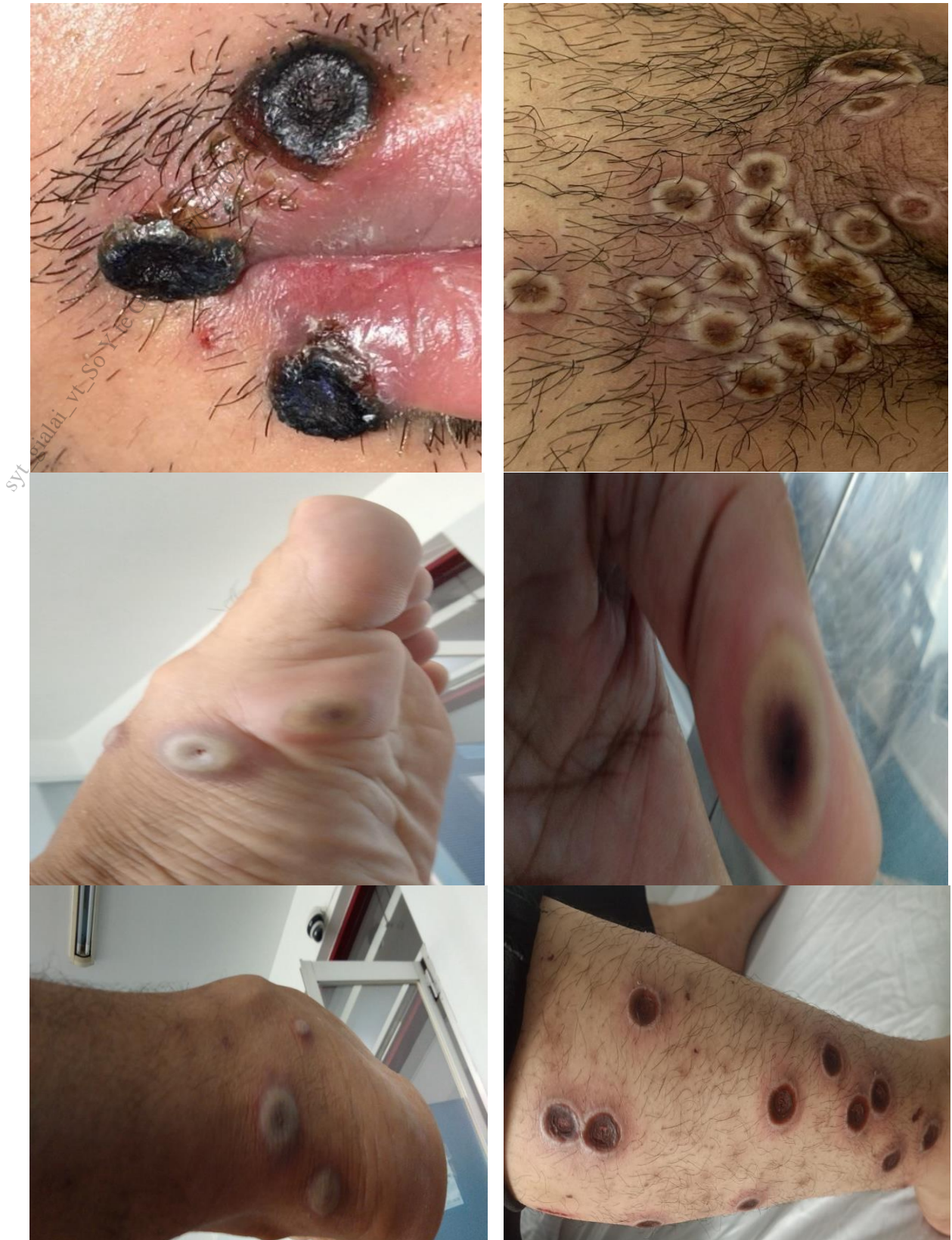
Hình 2. Hình ảnh tổn thương sâu