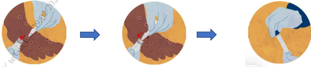
Hình ảnh minh họa về lấy mẫu da/vảy khô từ vết tổn thương

thương): sử dụng panh kẹp hoặc dụng cụ gấp (có đầu không sắc) vô trùng để gấp toàn bộ hay một phần da/vảy khô (kích thước ít nhất 4mmx4mm) rồi cho vào ống vô trùng (ống 1,5ml hoặc ống 5ml) không chứa môi trường vận chuyển. Sử dụng băng cá nhân để băng lại vết thương sau khi lấy mẫu.